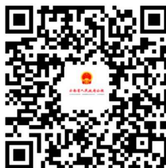
云南省人民政府政府公报支付宝小程序